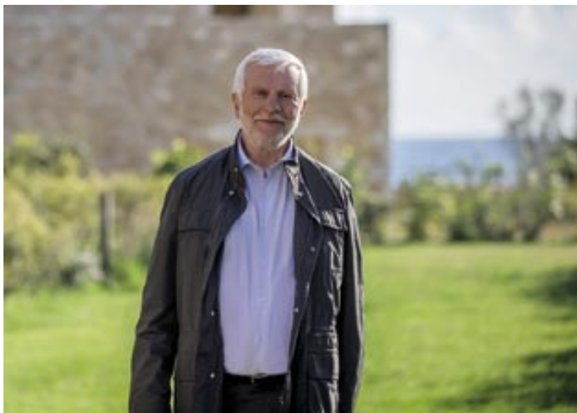
του Πέτρου Τατούλη Περιφερειάρχη Πελοποννήσου

Υπάρχει μια ιστορική ευκαιρία, για συνεννόηση και σύνθεση των πολιτικών δυνάμεων στον τόπο μας, που δεν μπορούμε να χάσουμε, σε αυτές τις Περιφερειακές και Δημοτικές εκλογές. Η απλή αναλογική που εφαρμόζεται, για πρώτη φορά, σε αυτήν την αναμέτρηση, αποτελεί ένα εκκολαπτήριο νεοφυών πολιτικών ζυμώσεων. Είναι η πρώτη φορά, ιστορικά, που τα αποτελέσματα αφορούν τους πολίτες. Αφορούν την εκπροσώπησή τους, ανεξαρτήτως παλαιών κομματικών ή ιδεολογικών συνόρων. Γιατί, για πρώτη φορά, το διακύβευμα αποτελούν τα τοπικά προβλήματα και οι λύσεις τους, και όχι η οπαδική επιλογή προσώπων. Γιατί ο άδολος πατριωτισμός των απλών ανθρώπων απαιτεί καθαρή σχέση των πολιτικών με τους πολίτες. Και η απλή αναλογική αποτελεί έναν καμβά που οι πολίτες, για πρώτη φορά, μπορούν να είναι πιο αποτελεσματικοί με την ψήφο τους.