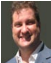
ΤΟΥ Π. Μνηματίδη