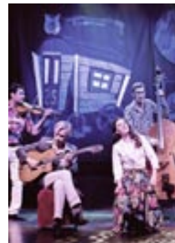
Gadjo Dilo, Beach Party Σάββατο 03/08 Άγιοι Θεόδωροι, Παραλία Πευκάκια