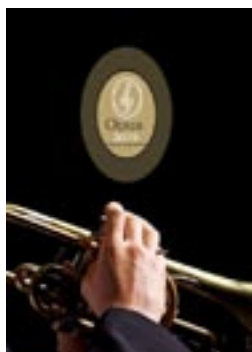
Opus 2019 Διεθνές Φεστιβάλ Κλασικής Μουσικής I Brass Academy 04-05-06/08 Πνευματικό Κέντρο Λουτρακίου