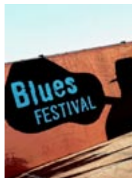
Blues Festival Παρασκευή 09/08 Πλατεία Αχιλλείων