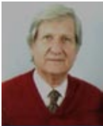
του Πλ. Μνηματίδη

Διαβάζω στις εφημερίδες ότι, την Κυριακή 2 Ιουνίου 2019, ημέρα του δεύτερου γύρου των περιφερειακών και δημοτικών εκλογών, η αποχή των ψηφοφόρων πολιτών έφτασε το 60%.