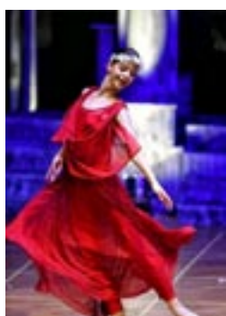
Ελληνικοί Χοροί του Μωρίς Μπεζάρ σε μουσική Θεοδωράκη Σάββατο 27/07 Παραλιακό Πάρκο Λουτρακίου