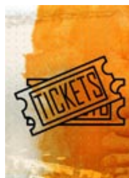
www.ticketservices.gr Αγοράστε τα εισιτήρια σας ηλεκτρονικά ή Κόρινθο & Λουτράκι!