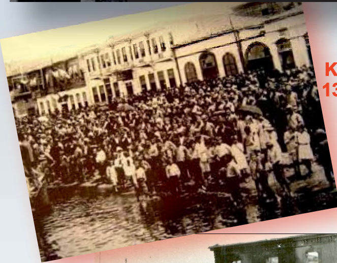
Καταστροφή της Σμύρνης 13 Σεπ 1922 – 17 Σεπ 1922