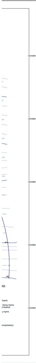
ΠΙΝΑΚΑΣ ΣΥΝΤΕΤΑΓΜΕΝΩΝ ΟΡΙΩΝ ΧΕΡΣΙΑΣ ΖΩΝΗΣ ΛΙΜΕΝΑ ΣΤΟ Ε.Γ.Α. '87