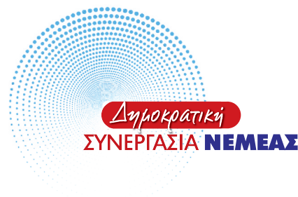
ΘΑΝΑΣΗΣ ΠΑΠΑΔΑΣ Υποψήφιος Δήμαρχος Νεμέας